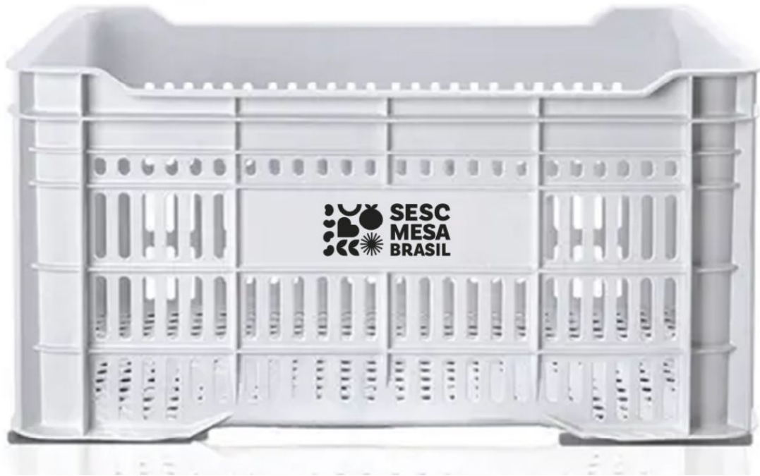
CAIXA VAZADA PERSONALIZADA